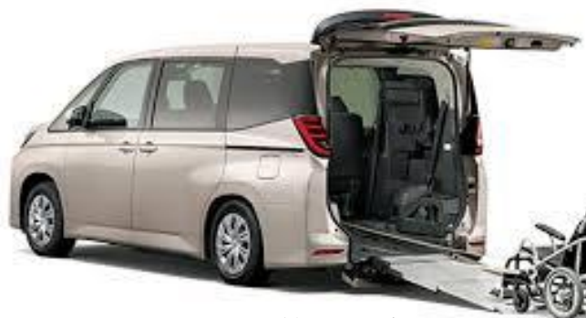
(車いすは搭載されていません。)