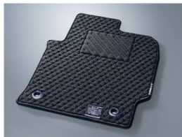
フロアマット (デラックスタイプ) ※写真はカラーラ スポーツ用