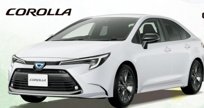
Photo:カラーラ 1.8 HYBRID W×B 2WD, ボディカラーのプラチナホワイトパールマイカ(089) [33,000円]は メーカーオプションで車両本体価格には含まれておりません。

カラーラ スポーツ価格帯 2,210,000円(2.0 G"X" 2WD) ~ 2,978,100円(1.8 HYBRID G"Z" 2WD)