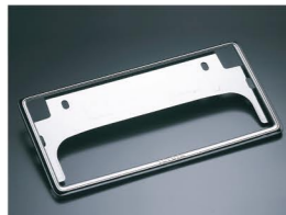
ナンバーフレーム (デラックス・ フロント&リヤ)

カラーラシリーズに定番アクセサリ+コーティング+ガラス撥水加工+メンテナンスパックをセットにした“おすすめ車”をご用意いたしました。